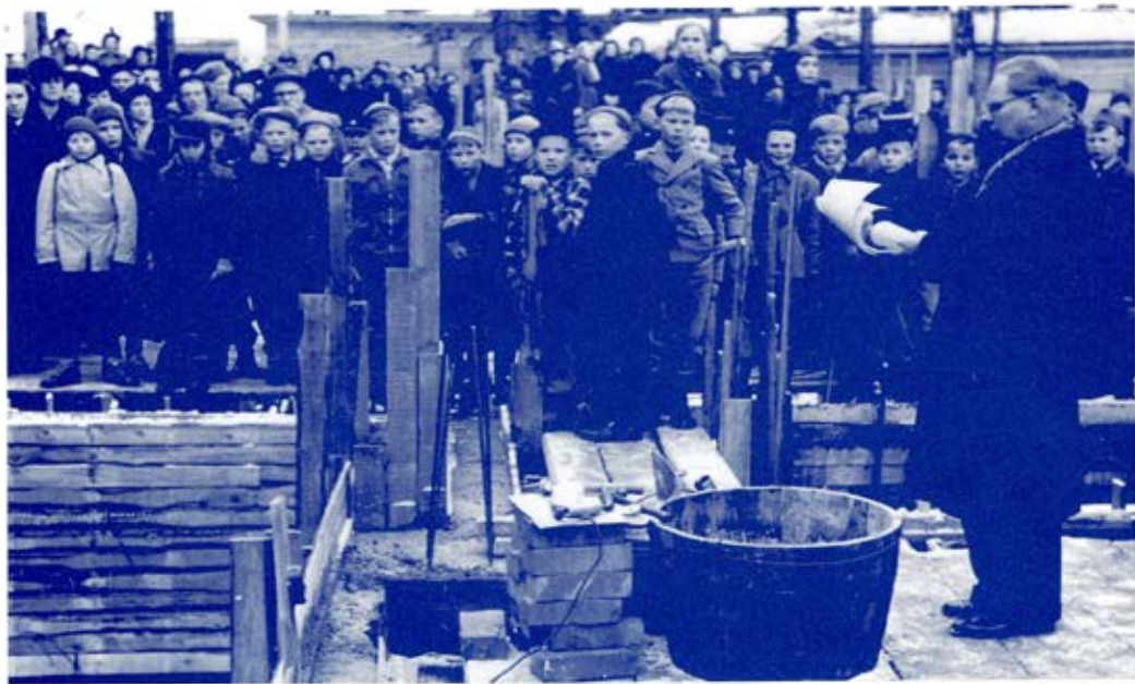
Peruskiven muurausta on todistamassa joukko Munkkiniemen yhteiskoulun oppilaita vuonna 1950