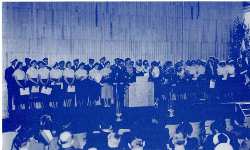
Ylioppilasjuhlat vanhassa voimistelusalissa vuonna 1953

Toivoimme yhteisesti, että toiminta jatkuu ja että kirjastolle lahjoitetaan korkeatasoista ja ajankohtaista kirjallisuutta tai varoja kokoelmien kartuttamiseen, kirjastomäärärahan ollessa vain yksi menoerä koulun monissa tarpeissa.